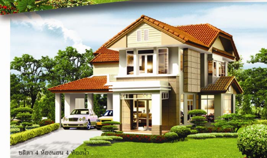
ชลิตา 4 ห้องนอน 4 ห้องน้ำ

สำนักงานขาย โทร. 02-732-4545, 02-732-4044