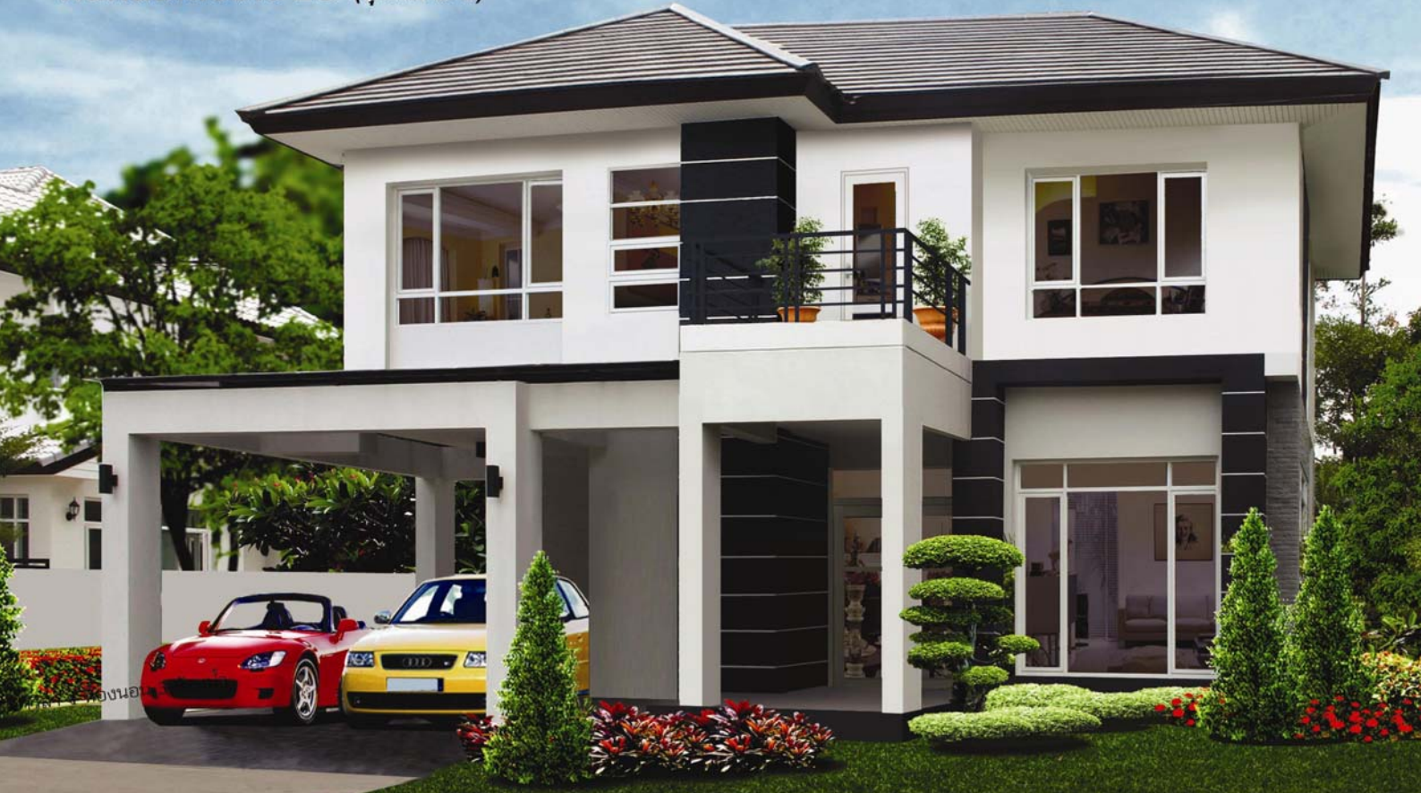
สิรินดา 4 ห้องนอน 4 ห้องน้ำ