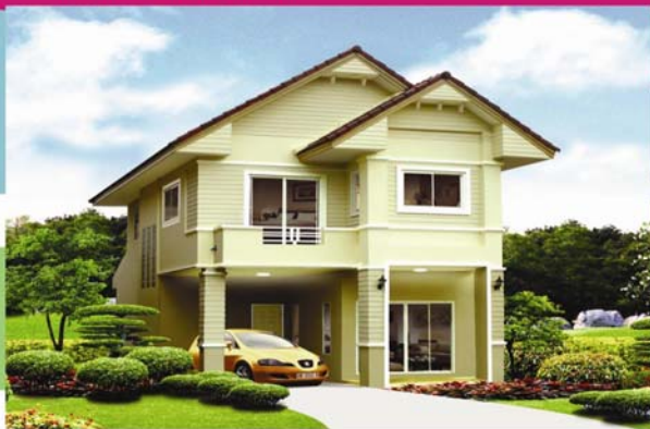
ชลลดา 3 ห้องนอน 2 ห้องน้ำ