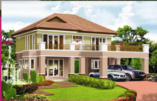
ปารีส 4 ห้องนอน 3 ห้องน้ำ